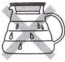
Konvici zvenku utřete