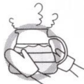
Konvici uchopte pevně kolem dokola i za držadlo